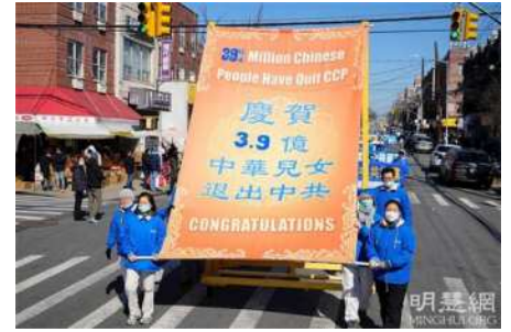
图15~18：第三方阵声援3.9亿中国人退出中共邪恶党、团、队组织

第三方阵声援三退大潮，呼吁世人看清中共的邪恶，赶快退出曾经入过的中共党、团、队（三退），不要为中共的罪行背黑锅，做个清清白白的中国人。三退大潮始于二零零四年十一月发表的大纪元系列社论《九评共产党》。《九评共产党》系统地回顾了中共的真实历史，以大量的事实揭露了共产党的邪恶本质，令海内外华人震撼。自二零零四年十二月大纪元网站收到第一份三退声明，迄今有三亿九千万人正式宣布退出中共。