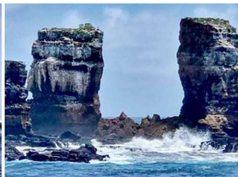
▲二零二一年五月十七日，厄瓜多尔环境部公布：“达尔文拱门”崩塌。左图是坍塌前的拱门。右图显示，该拱门仅剩下两根柱子。