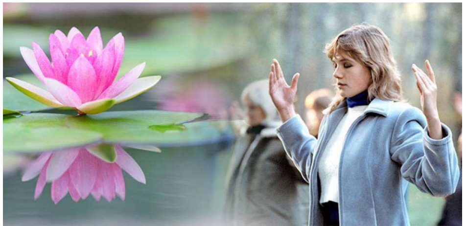
法轮功第二套功法演示

他说：“我们当初那么为共产党卖力，现在却成了共产党要清除的‘害群之马’。你说讽刺不讽刺？”◇