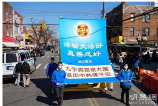
图1~8：第一方阵“法轮大法好”的游行队伍

第一方阵是“法轮大法好”。游行队伍由警车开道，天国乐团打头，为当地民众带来“法轮大法好”、“送宝”、“凯旋”、“神圣的歌”等曲目。嘹亮的鼓乐声，伴随着大法书模型，转动的法轮图形，巨大的“法轮大法好”展板，美丽的“法轮大法好”横幅，瞬间吸引了众人的目光。一些民众告诉家人朋友“法轮功游行”，并用手机分享视频。