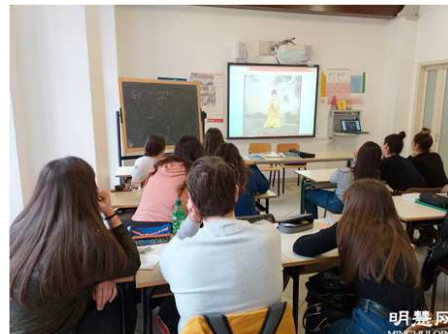
▲上图：课堂上学生们认真观看师父教功视频。↓下图：高中生们正在学炼第五套功法-打坐。

今年的5月13日是世界法轮大法日，高中的学生们也真诚地双手合十，感激法轮大法师父将大法传给世界，使他们能听闻并受益于大法的美好！他们真诚地恭祝师父生日快乐！并祝贺世界法轮大法日！ ◇