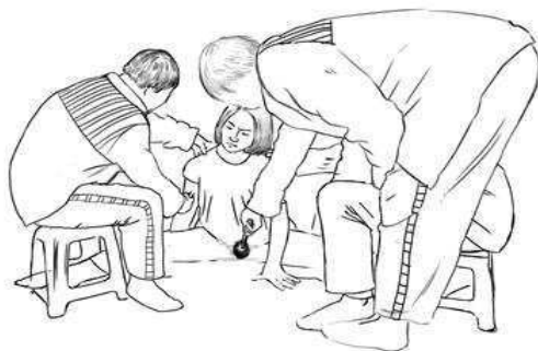
酷刑示意图五：双腿强行一字劈开，捣下身私处。

山东女子监狱恶警指使犯人强行将法轮功学员的双腿一字劈开。同时犯人手指还狠命地拧掐着法轮功学员的胳膊内侧，两个塑料板凳不断地向身后挪，痛得法轮功学员直打颤，被折磨得疼痛惨叫。