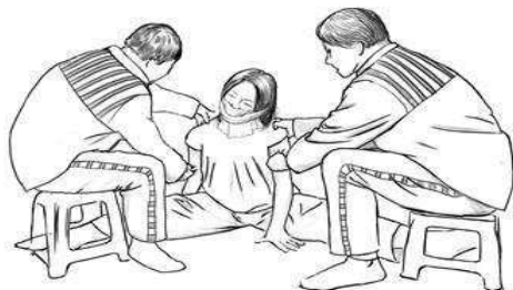
酷刑示意图四：双腿强行一字劈开。

看到刑事犯扔的垃圾袋中有血淋淋的纸或布，这充分说明还有更令人发指的迫害没被曝光出来。