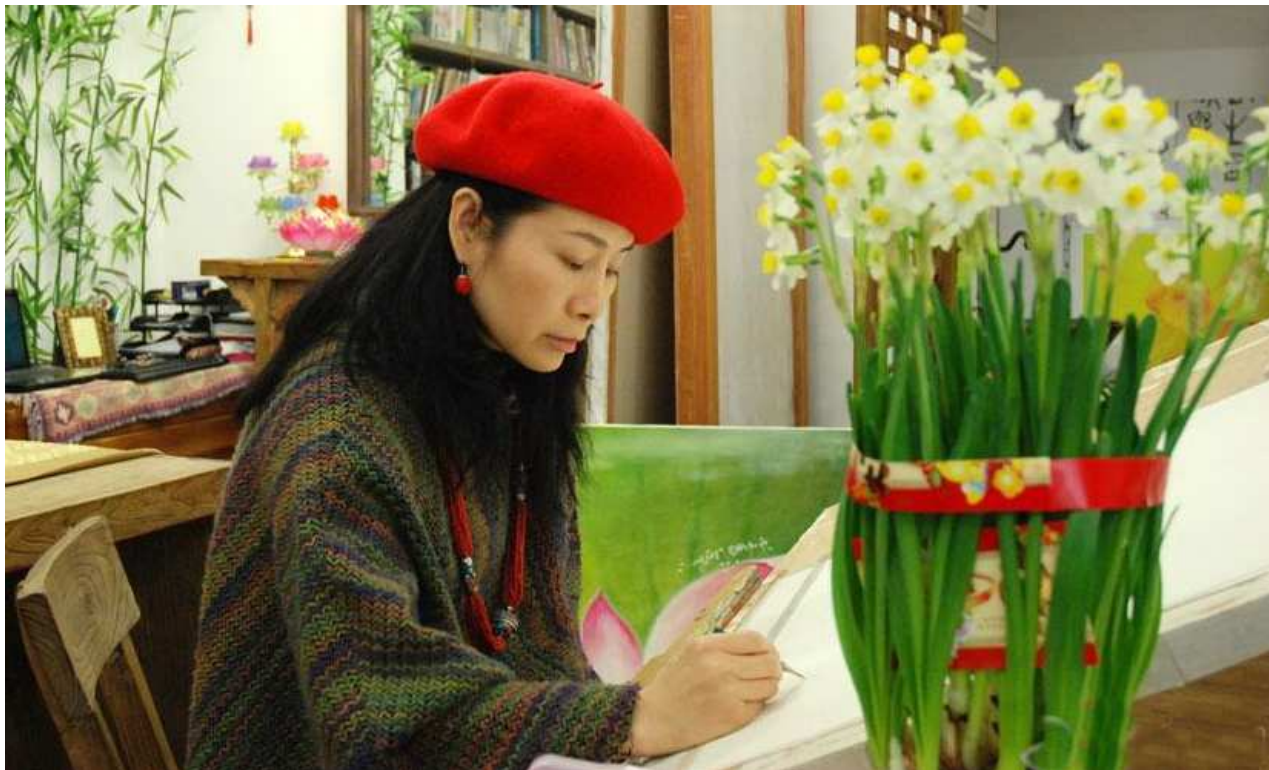
图1 艾欣在创作中

她叫郑艾欣，祖籍福建，1967年9月26日出生于广东罗定，中国知名画家，擅长油画、书法，爱好古琴。1992年在珠海读完大学后，到广州美术学院中国画系进修。1993年5月到中国后现代研究所工作，研读哲学、心理学、素描和书法等课程，主攻油画。