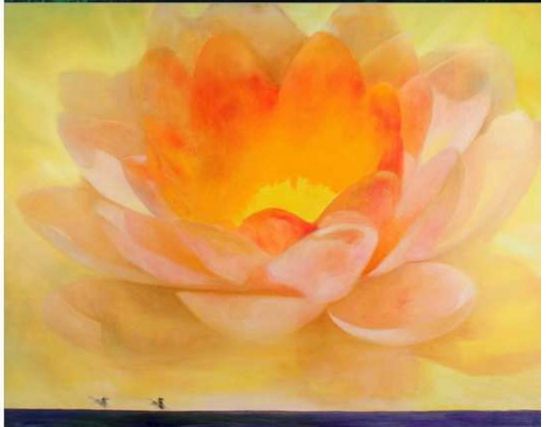
图4 艾欣作品：左-慈悲散香风；右上-超越；右中-回响之一；右下-回响之三