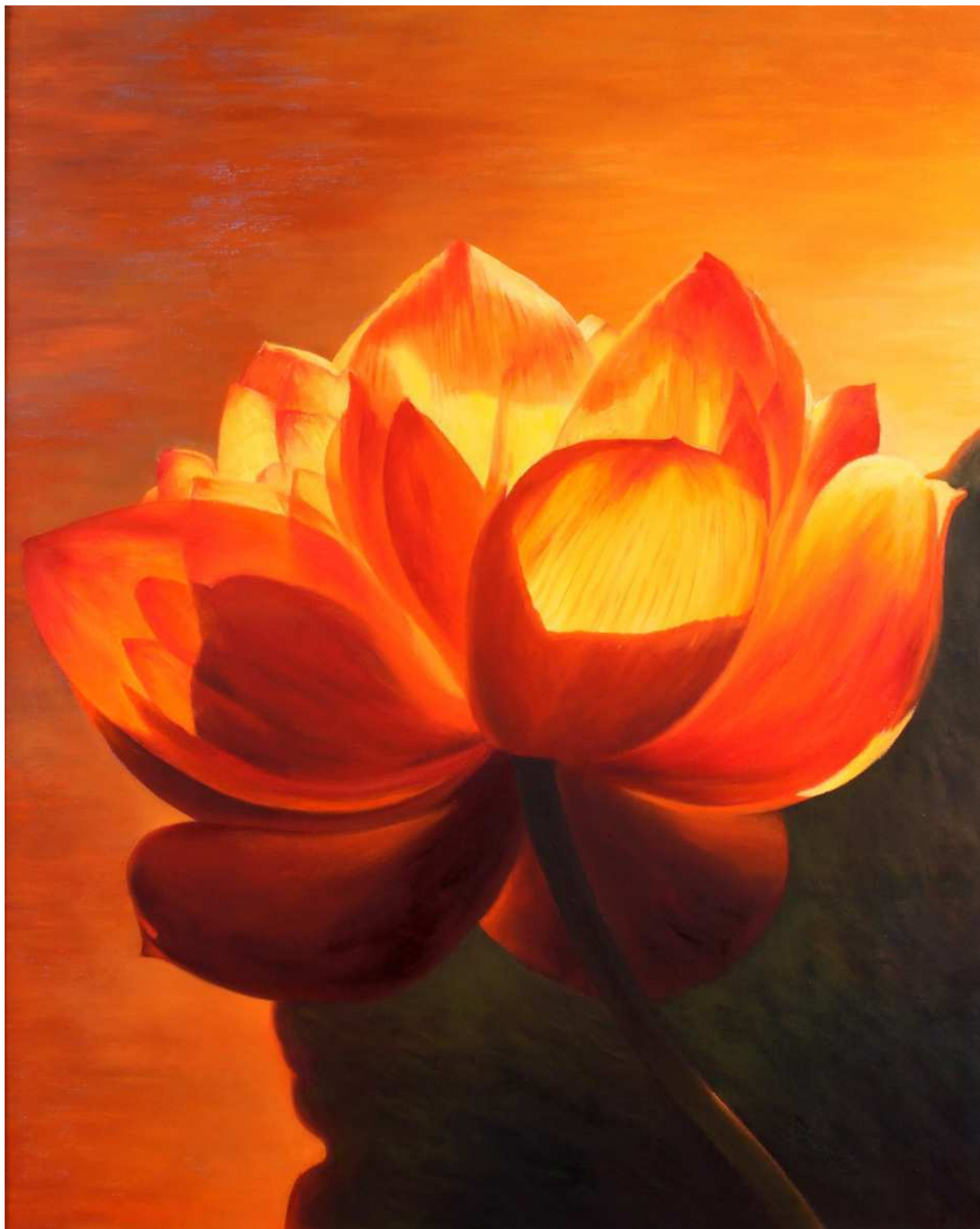
图6 艾欣作品：精进

有评论说：艾欣女士后期醉心于描绘各式各样的莲，画的就不只是花了，而是在表达她对生命的理解，画的是一种神圣的生命之灵。艺术作品的伟大在于永恒的主题，体现了艺术家对上苍、对生命、对具有无量智慧的高级生命的虔诚和敬畏之心。