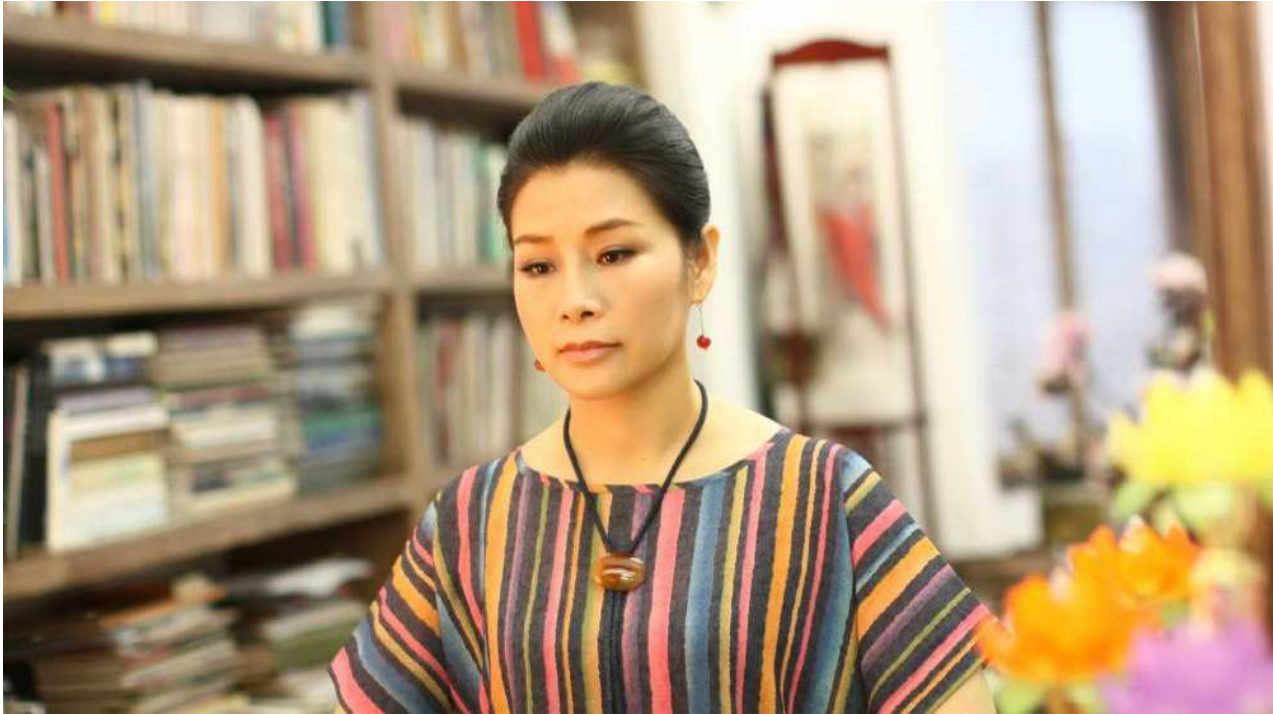
知名画家郑艾欣女士