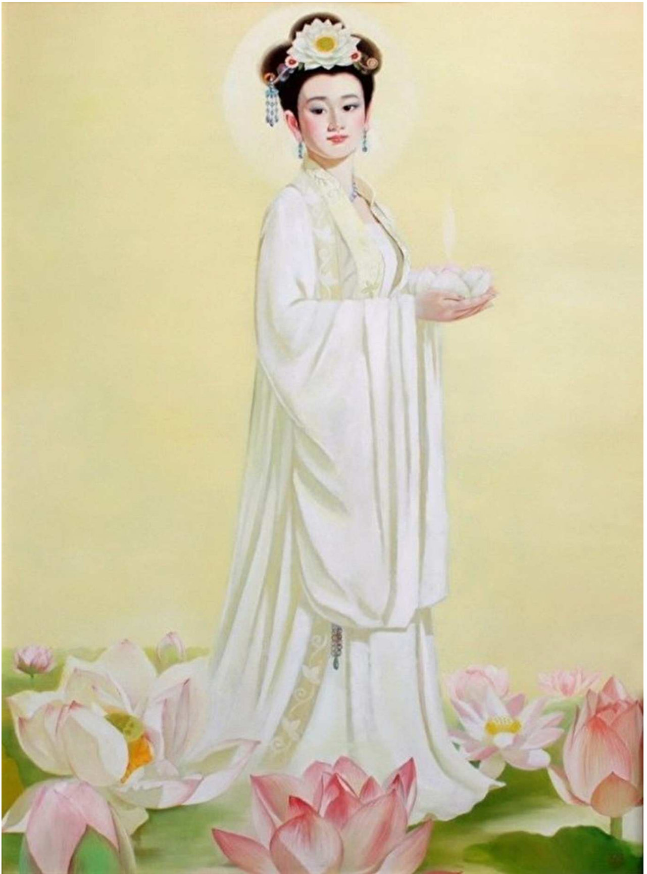
图7 艾欣作品：花仙子

总之，她的作品具有深刻内涵，富有诗意，给人以博大、吉祥和宁静之感。她致力于通过画笔诠释人性中最纯净、圣洁的一面，能净化人的心灵。之所以能达到如此境界，源于她对艺术有着圣徒般的虔诚和崇敬，她是当代画坛极具潜力、独树一帜的艺术家。