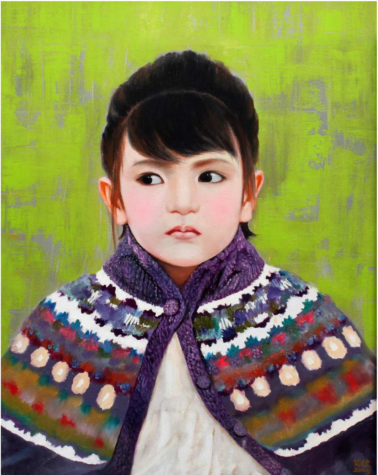
图8 艾欣作品：宝贝别任性

在艾欣女士走入法轮功修炼一年之后，即1999年7月20日，以江泽民为首的中共邪恶集团发动了对法轮功的全面镇压，艾欣女士也因此受到了中共的残酷迫害。