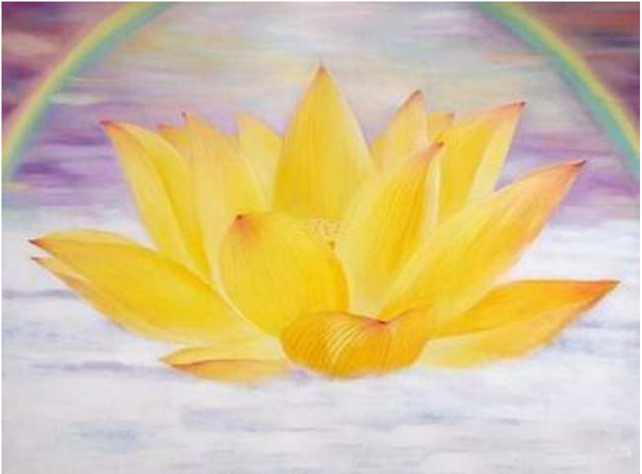
图5 艾欣作品：金莲呈祥

在以花为主题的作品中，其中又以“莲”居多。她十分大胆的将东方神传文化中极富神秘色彩和生命奥妙的莲花，与天地、宇宙时空等巧妙的结合起来，赋予博大的诗情和禅意，能使人产生无限遐想，所以她笔下的莲花具有深刻内涵。