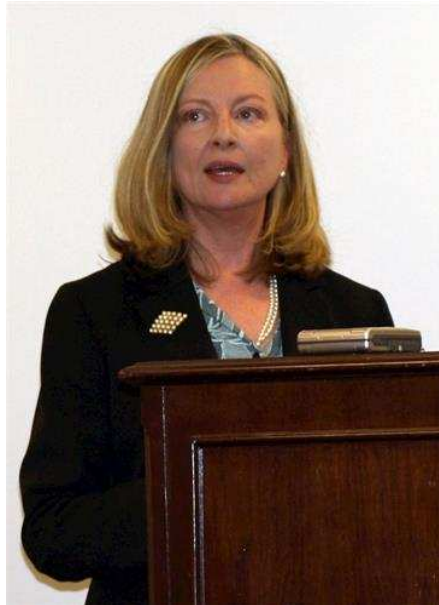
图1：哈德逊研究所宗教自由中心主任妮娜·谢伊 (Nina Shea)

美国《国家评论》杂志 (National Review) 二零二二年二月四日刊登作者妮娜·谢伊 (Nina Shea) 的文章说，严谨的报告表明，数量众多的法轮功学员在中国被关押期间被进行活摘器官，这不可避免地杀死了他们。