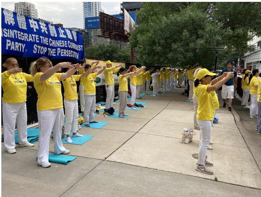
图9~10：二零二二年八月十三日，美国中部的部份法轮功学员在芝加哥中领馆前集会，抗议迫害。