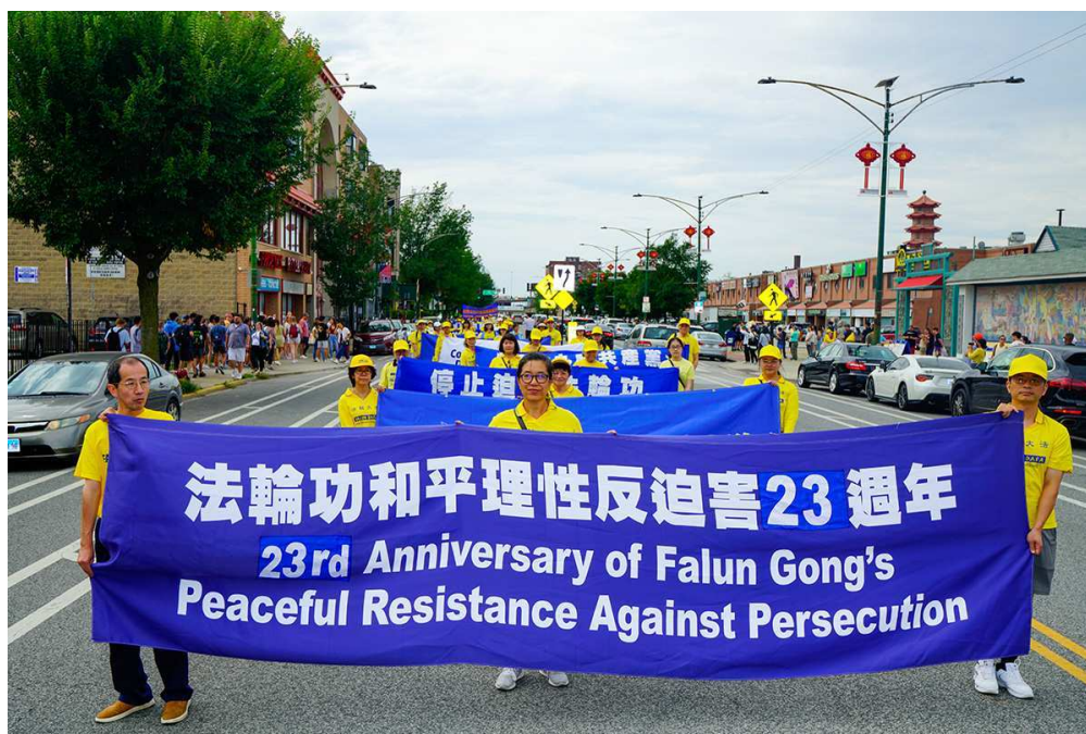
图1~5：二零二二年八月十三日，美国中部十几个州的部份法轮功在芝加哥中国城举行大游行。