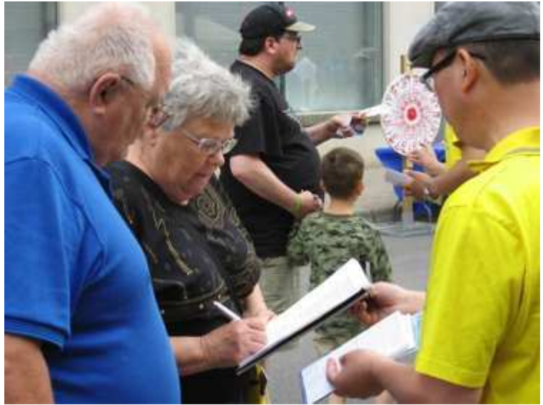
台高雄万人签名 谴责中共强摘器官